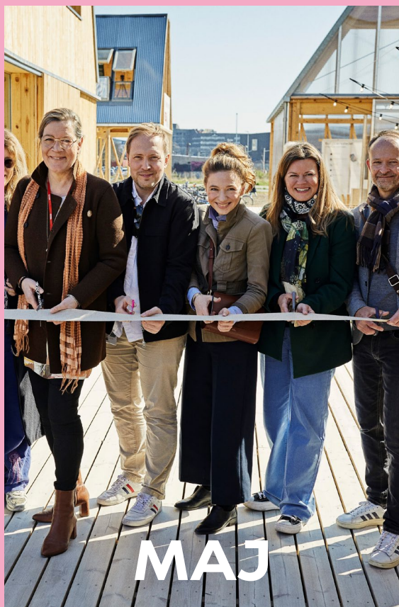
Billedet er fra den officielle åbning af pavillonen Boligværkstedet af VELUX og Effekt i Jernbanebyen.