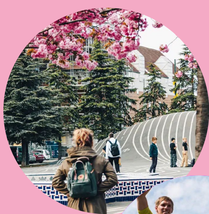
DAC's udstilling Copenhagen in Common fejre Arkitekturhovedstad 2023 og byder på en vild oplevelse når professionelle slackliners krydser havnen.