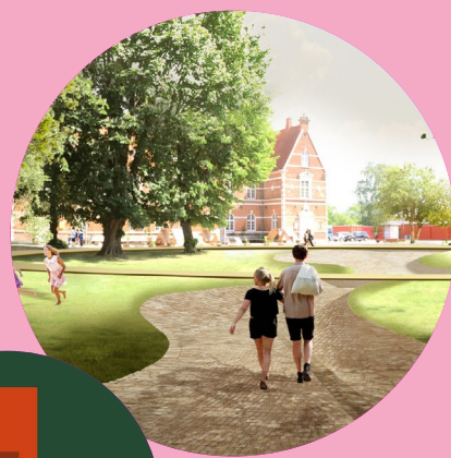
Visualisering af den nye Karens Minde Akse i Sydhavnen, som åbner den 26. maj.